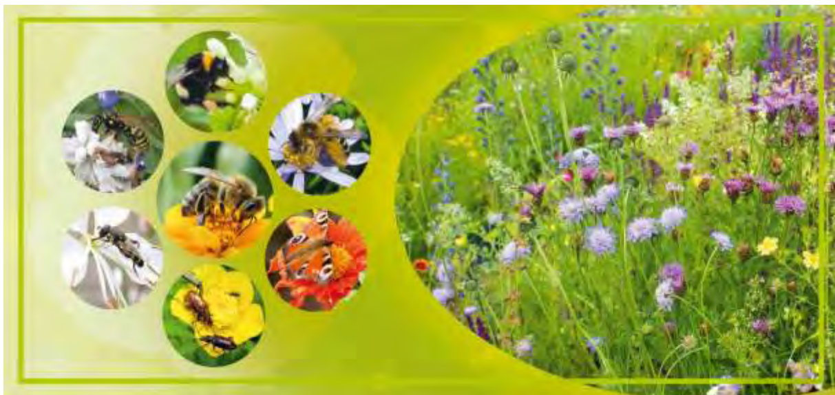
Abb. 1: Eine Vielzahl an Insekten besuchen Blüten. Honigbienen, Hummeln und Wildbienen, aber auch Schmetterlinge, Käfer und Fliegen ernähren sich von Nektar und Pollen.

Zu den Hautflüglern gehört die Gruppe der Bienen. Diese Gruppe umfasst in Deutschland über 580 Arten. Die solitär lebenden Wildbienen bilden den größten Anteil an dieser Gruppe. Ferner zählen soziale Wildbienen wie z. B. Hummeln und einige Furchenbienen (z. B. Lasioglossum ) dazu, die einjährige Nester bilden. Die Honigbiene ist die einzige Bienenart in Deutschland, die mehrjährige Nester anlegt und mit mehreren tausend Tieren überwintert. Neben den Bienen gehören auch Wespen zu den Hautflüglern. Während die Mehrzahl der Wespen für ihre eigene Ernährung Nektar und andere Pflanzensäfte benötigen, brauchen sie für die Aufzucht ihrer Brut tierische Nahrung. Im Gegensatz dazu sind Bienen sowohl für ihre eigene Ernährung als auch für die Aufzucht ihrer Brut überwiegend auf Blütenprodukte angewiesen.